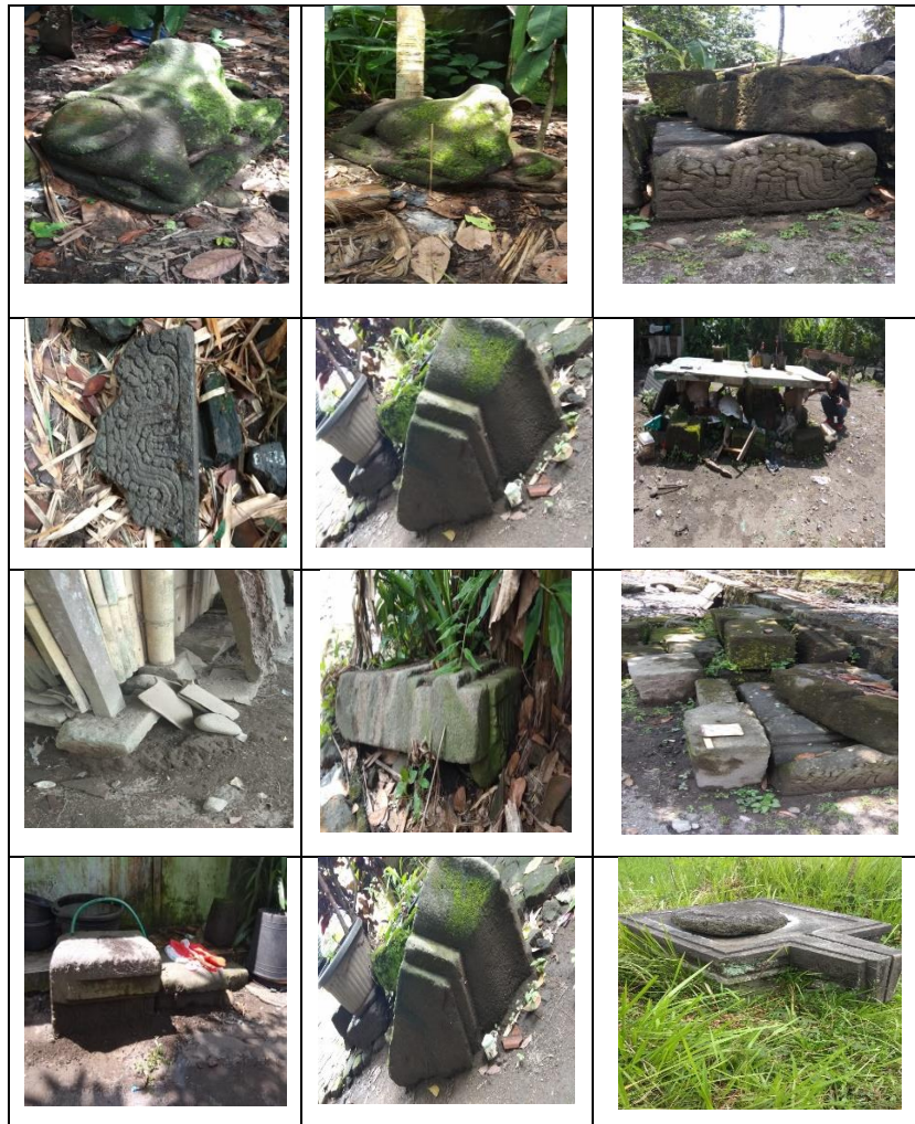
Gambar 3 Beberapa Sebaran Komponen Candi di Wilayah Sumberadi