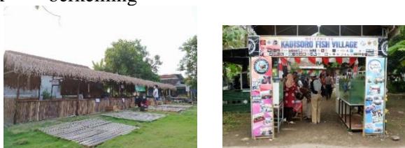
Gambar 1. Obyek wisata ikan hias di Kadisoro

Dusun Kadisoro merintis budidaya ikan hias sejak tahun 2004 dan terbentuk kelompok perikanan Buana Mina Kadisoro. Berbagai prestasi seperti juara ikan hias terbaik ke-3 tingkat nasional pada tahun 2009 dan juara 1 tingkat nasional tahun 2015 telah diraih, bahkan mewakili DIY dalam kompetisi Adi Bakti Mina Bahari dan ditetapkan Pemerintah Kabupaten Bantul sebagai kawasan Mina Politan dalam bidang perikanan maupun pertanian (Suswanta, Atmojo and Sakir, 2020). Dengan keunggulan tersebut maka dusun Kadisoro menawarkan daya tarik wisata berupa edukasi, rekreasi, outbond , dan kuliner.