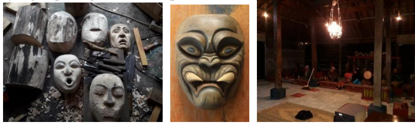
Gambar 5 Daya tarik sanggar di Desa Gilangharjo

hari seperti tas, dompet, dan sebagainya. Selain sanggar, di area ini juga terdapat beberapa homestay untuk menyediakan tempat menginap para wisatawan yang berkunjung.