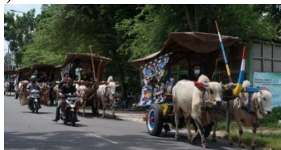
Gambar 6 Daya tarik gerobak Sapi

Wisata gerobak sapi merupakan inovasi dusun Jodog, desa Gilangharjo, tanpa berseberangan dengan konsep desa wisata. Wisata ini menghidupkan kembali transportasi jaman dahulu yang dikelola oleh Paguyuban Gerobak Sapi Guyup Rukun Kabupaten Bantul. Wisata ini menawarkan pengalaman naik gerobak sapi dengan mengelilingi wilayah Jodog dan Karangasem sehingga wisatawan dapat menikmati pemandangan bernuansa tradisional. Harga yang ditawarkan pun terjangkau yaitu tarif Rp 70.000 untuk satu gerobak yang bisa dinaiki untuk 5 orang dewasa atau 7 orang anak-anak (Sigit, 2022).