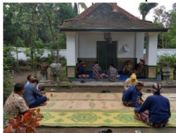
Gambar 3. Pasujudan Gilang Lipuro

Pada tahun 1746 danau tersebut ditimbun dengan tanah oleh Sinuwun Pakubuwono II dengan tujuan mendirikan bangunan "Petilasan Pasujudan Gilanglipuro" untuk melestarikan Gilanglipuro. Gilanglipuro terdiri dari kata "Gilang" yang artinya batu dan "Lipuro" yang berarti pelipur lara (Bayudi and Wiryosenjoyo, 2015). Di tempat tersebut saat ini disajikan pertunjukan sendratari 'Lintang Johar' yang menggambarkan asal mula Desa Gilangharjo yang berhubungan dengan Kerajaan Mataram, kedatangan Sutawijoyo di Desa Gilangharjo, munajatnya, dan 'wahyu lintang johar' yang diperolehnya sehingga bergelar Panembahan Senopati dituangkan dalam tarian (Adi, 2017).