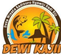
Gambar 2. Logo Dewi Kaji