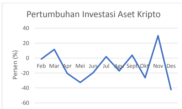
Gambar 3.2 Grafik Pertumbuhan Investasi Aset Kripto Tahun 2022