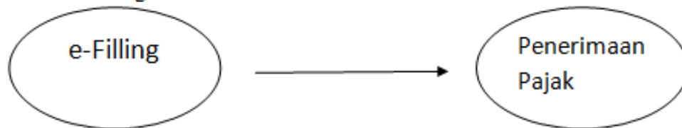
Gambar 1. Kerangka Pikir

Hipotes dalam penelitian ini sebagai berikut: